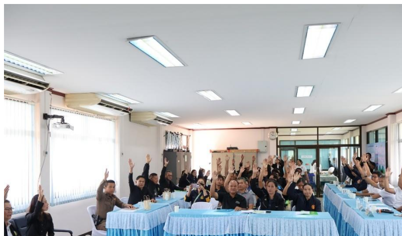
ผู้เข้าร่วมประชุมลงความเห็นสนับสนุนโครงการ