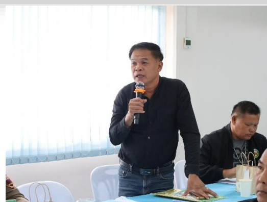
เปิดโอกาสให้ผู้เข้าร่วมประชุมซักถาม แสดงความคิดเห็น