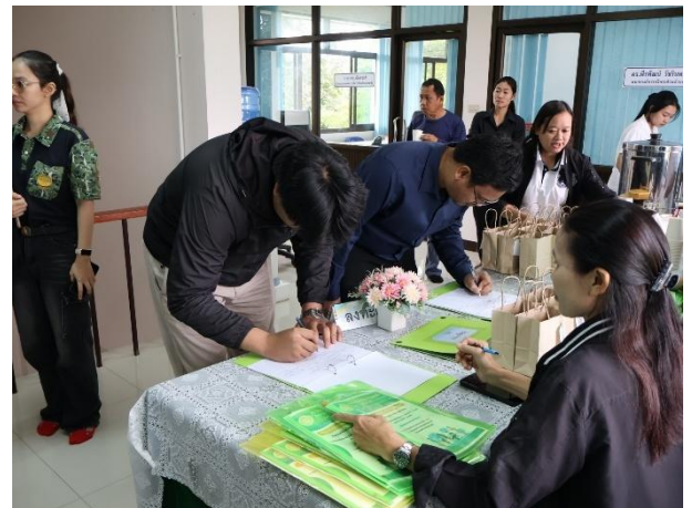
ผู้เข้าร่วมประชุมลงทะเบียน