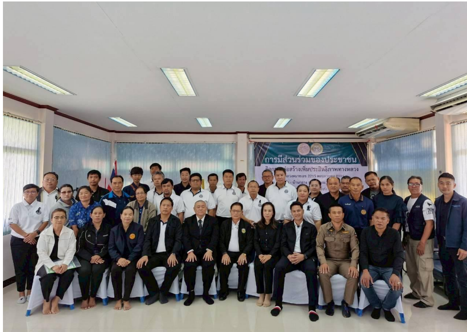
หน่วยงานที่เกี่ยวข้องในพื้นที่ถ่ายภาพร่วมกับเจ้าหน้าที่ของกรมทางหลวง