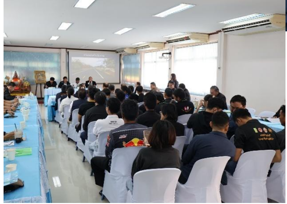
ผู้เข้าร่วมประชุม