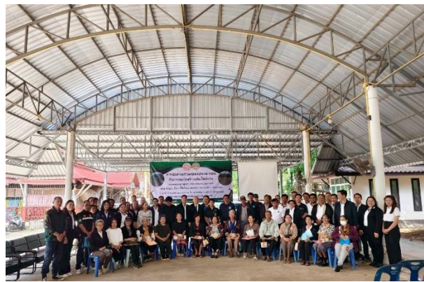
หน่วยงานที่เกี่ยวข้องในพื้นที่ถ่ายภาพร่วมกับเจ้าหน้าที่ของกรมทางหลวง