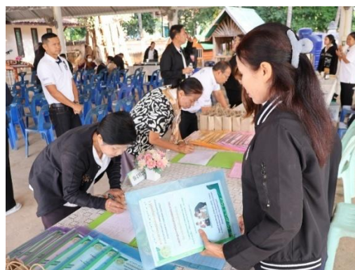
ผู้เข้าร่วมประชุมลงทะเบียน