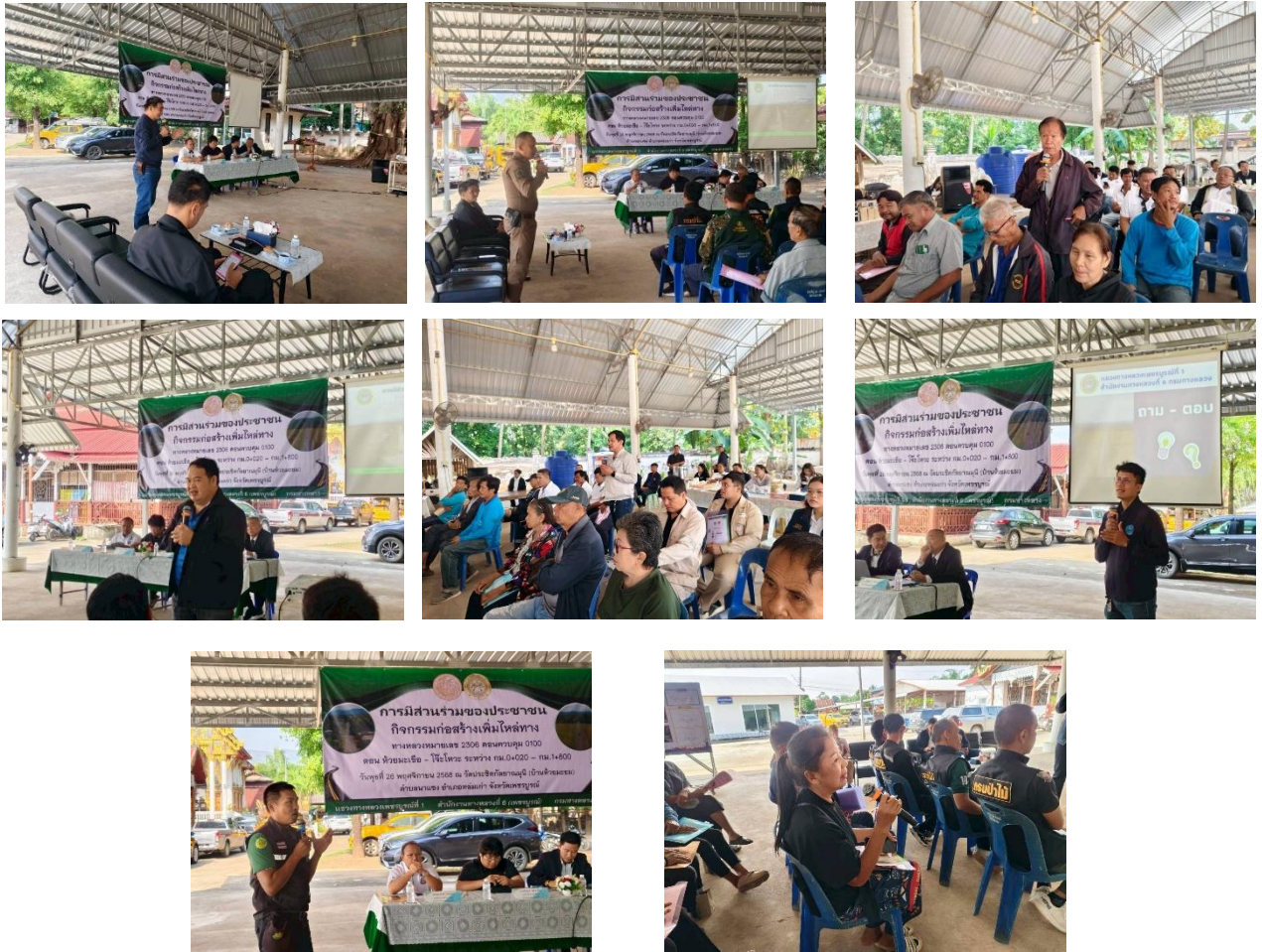
เปิดโอกาสให้ผู้เข้าร่วมประชุมซักถาม แสดงความคิดเห็น