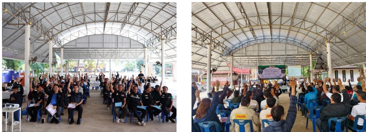
ผู้เข้าร่วมประชุมลงความเห็นสนับสนุนโครงการ