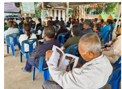
ผู้เข้าร่วมประชุม